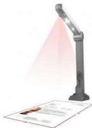
اسکنر جدید متن و تصویر گدالک