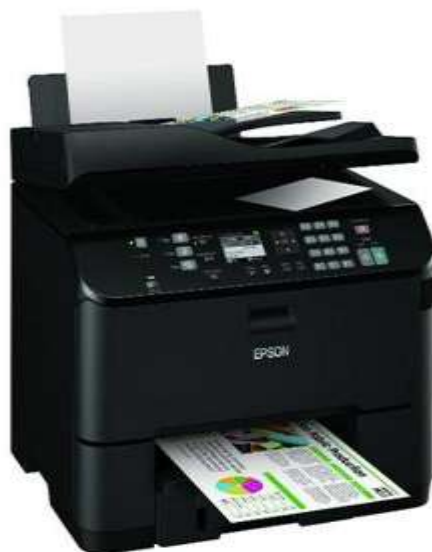
جایگزین‌های جدید اپسون در جینکس 2011