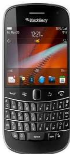
گوشی جدید Bold 9900 بلک‌بری