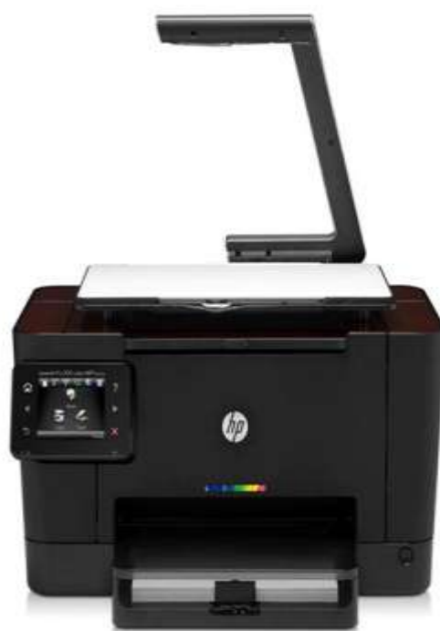
شرکت اچ‌پی جایگزین جدیدی با قابلیت اتصال به فناوری کلاود رونمایی کرد