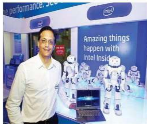
شرکت اینتل از آتریابوک‌های جدید خود پرده‌برداری کرد