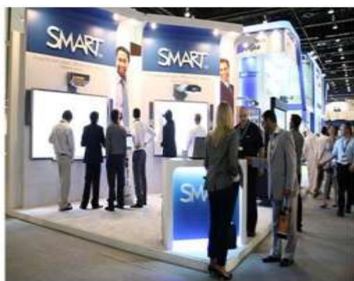
وابسته‌های آموزشی تعاملی شرکت Smart