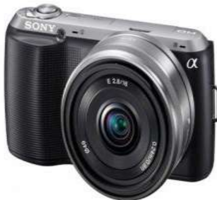
دوربین Sony Alpha NEX C3