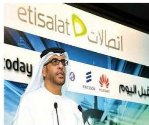
شرکت اتصالات وعده فناوری‌های 4G روی نوت‌بوک داده است