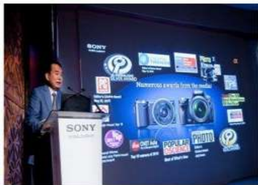
مدیران سونی در نمایشگاه مشغول معرفی دوربین‌های جدید