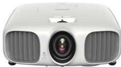
دو محصول پروژکتور جدید اپسون معرفی شدند