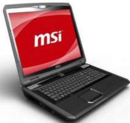
نوت‌بوک مخصوص بازی جدید MSI GT780